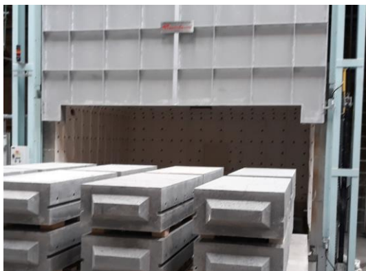
Zaladunek blokami wielogabarytowymi

Suszarnia komorowa z wysuwym trzonem przeznaczona jest do suszenia i temperowania w wysokiej temp. mało- i wielkogabarytowych prefabrykatów betonowych. Kształt komory oraz budowa powierzchni trzonu umożliwiają optymalne wsadu podgrzanym powietrzem.