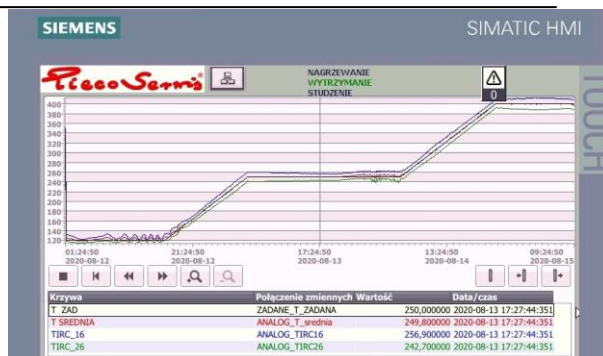
Wieloodcinkowa krzywa procesu – faza nagrzewania i wytrzymania

Układ sterowania poprzez zespół czujników temperatury oraz ciśnienia zapewnia stabilny i optymalny rozkład temperatury wewnątrz komory.