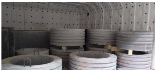
Zaladunek blokami malogabarytowymi