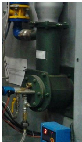
Zabudowa palnika na ścianie pieca

Palnik RPG jest palnikiem bezpośredniego spalania, który w korpusie ma zabudowany wymiennik ciepła spaliny – powietrze spalania. Podgrzanie powietrza spalania do wysokiej temperatury pozwala uzyskać dość znaczną redukcję zużycia gazu w porównaniu do tradycyjnych palników. Na wartość temperatury powietrza spalania dla danej powierzchni wymiany ciepła ma wpływ temperatura oraz ilość odsysanych spalin z komory spalania. Moc cieplna palnika - dla danego ciśnienia gazu, jest określona przez opór hydrauliczny dyszy gazu oraz kształtki wylotowej płomienia. Wraz ze wzrostem temperatury powietrza spalania następuje wzrost mocy cieplnej palnika.