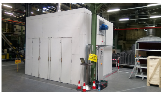
Rys.2 Istniejąca suszarnia

Czynnik suszący recyrkuluje w suszarni do stanu nasycenia wilgocią lub do zadanej temperatury. Nadmiar czynnika suszącego usuwany jest przez komin, a niedobór jest uzupełniany świeżym powietrzem z otoczenia.